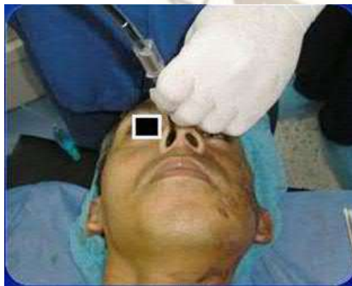
Figura 4: Avance Fibrobronscopio