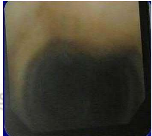
Figura 6: La carina