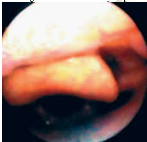
Figura 5: Cuerdas vocales y tráquea