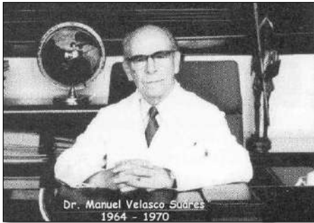
Figura 3. Dr. Manuel Velasco Suárez