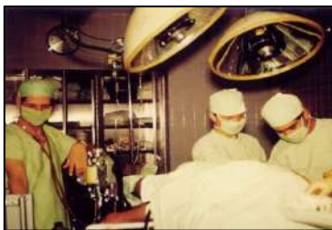
Figura 1. Quirófanos del INNN en 1965