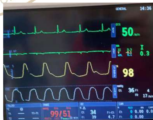
Figura 2: El \text{CO}_2 en ventilación espontánea

Considerando que en la gran mayoría de los casos de cirugía plástica el cirujano infiltra el área quirúrgica deberemos de pensar en un procedimiento anestésico que no sea tan invasivo como en el caso de una anestesia general (intubación), pero que permita trabajar al cirujano cualquier área del cuerpo y sobre todo si hablamos de procedimientos de mínima invasión, como en el caso de una blefaroplastia (por ejemplo), creo que es la técnica ideal para estas cirugías, pues la mayor concentración del fármaco se realizara solo mientras el cirujano realice la infiltración del anestésico local, y una vez infiltrado, nos permite bajar las concentraciones de los fármacos, y mantener las concentraciones lo más pegado al piso del rango terapéutico y con eso realizar despertares lo más parecidos a lo fisiológico y con el mínimo de efectos secundarios. Y en otro tipo de procedimientos como en el caso de ritidectomias en donde las mayores complicaciones se presentan a la hora de la extubación por el esfuerzo tan grande que realizan al toser, (en muchas de las veces) lo que condiciona la posibilidad de hematomas en cara, considero la sedación es también una buena opción, sin olvidar los principios del monitoreo en todas las anestесias pero sobre todo en el caso de la sedación tanto el monitoreo cerebral como el caso de \text{CO}_2 que resultan imprescindibles. (Figura 2 y 3).