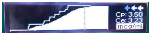
Fig. 1. Titulación de propofol .

No olvidar que de acuerdo a los perfiles de cada fármaco éste es el orden de recomendación para perfundir opioides en primer lugar remifentanilo y en segundo lugar sufentanilo y en último lugar (pero es el opioide existente en todos los medios) fentanilo , sin olvidar de éste la alta liposolubilidad lo cual le confiere la posibilidad de acumularse con el tiempo de la perfusión de ahí que debemos de considerar la vida media sensible al contexto de cada opioide, pero del fentanilo en especial. No es el ideal.