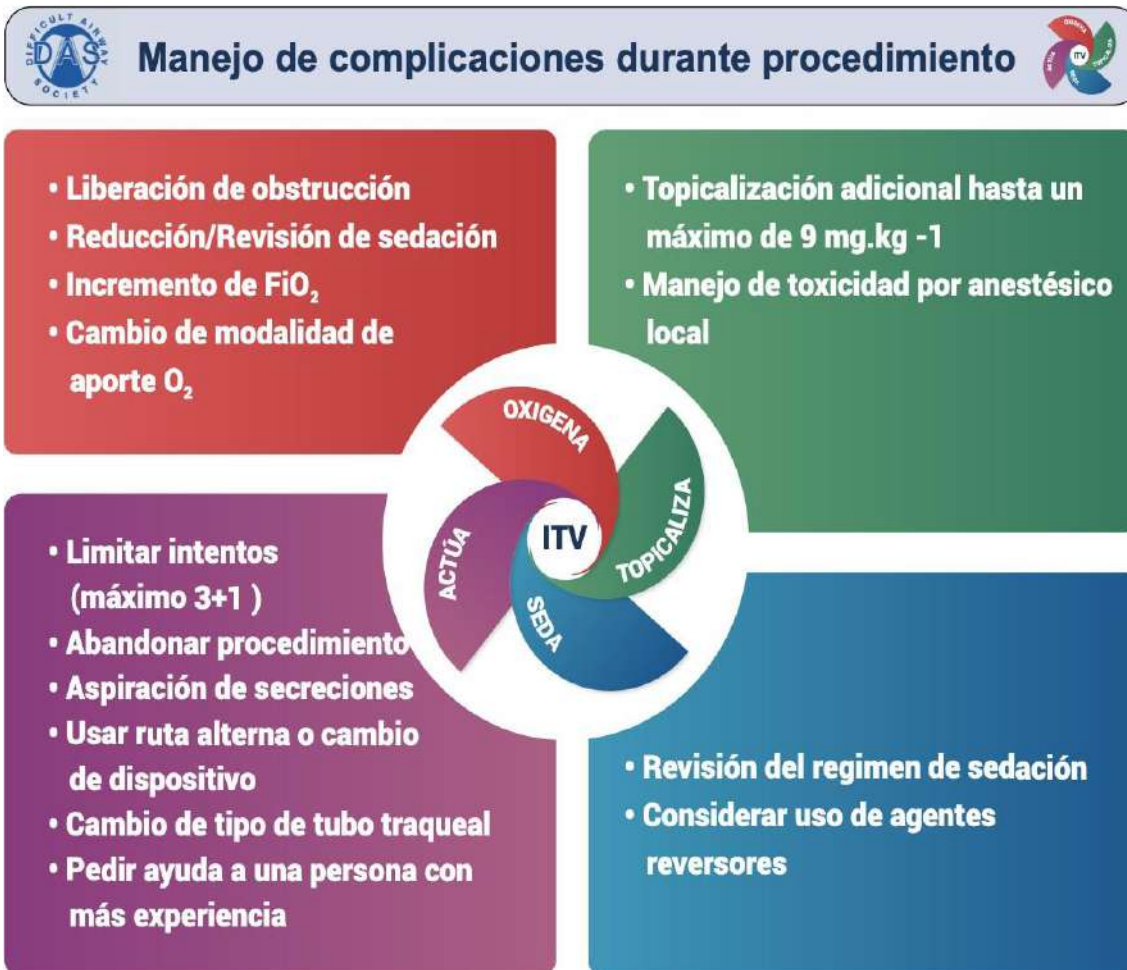
Figura 3. Manejo de las complicaciones del procedimiento durante Intubación Traqueal Vigil (ITV). Esto proporciona un marco para manejar complicaciones, pero no pretende ser una guía completa. Esta figura forma parte de las Guías de la Sociedad de Vía Aérea Difícil para ITV en adultos y debe ser utilizada en conjunto con el texto. FiO_2 , fracción inspirada de oxígeno; O_2 , oxígeno. ♥ Difficult Airway Society 2019.

Si el manejo de la vía aérea se considera esencial, la opción preferida para asegurar la vía aérea después de ITV: FB o ITV:VL fallida, debe ser ITV utilizando el acceso frontal del cuello (ITV: FONA), lo cual incluye cricotiroidotomía o traqueostomía (Grado D). El clínico más entrenado disponible debe realizar esta (Grado C). Las consideraciones para una ITV: FONA más apropiadas incluyen factores del paciente, experiencia y disponibilidad de equipo. Si es inapropiada o no exitosa, la anestesia general de alto riesgo es la única opción restante en este escenario. El operador debe formular una estrategia de manejo realizable de A–D, informado por los intentos no exitosos de ITV basado en las guías de la DAS 2015 [2], reconociendo que estas son principalmente para intubación traqueal difícil no anticipada (Grado D). Esta estrategia debe incluir una inducción anestésica intravenosa con bloqueo