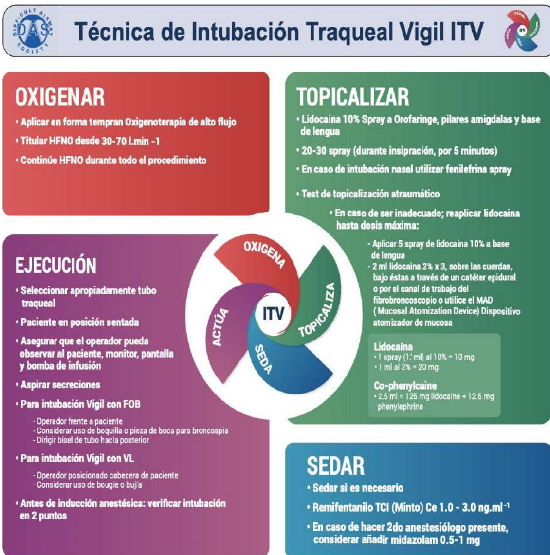
Figura 2. La técnica de intubación Traqueal Vigil de la Sociedad de Vía Aérea Difícil (DAS). Esta figura forma parte de las Guías para Intubación traqueal vigil en adultos de la DAS y debe ser utilizada en conjunto con el texto. HFNO: oxígeno nasal de alto flujo; FOB: broncoscopia flexible; MAD: dispositivo para atomizar mucosas; TCI: infusión controlada por objetivo; CE: concentración sitio-efecto; VL: videolaringoscopia. ♥ Difficult Airway Society 2019.